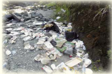
バーベキューごみの不法投棄